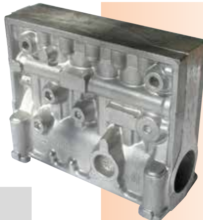
■ Gußteil "Gehäuse für Einspritzpumpe"