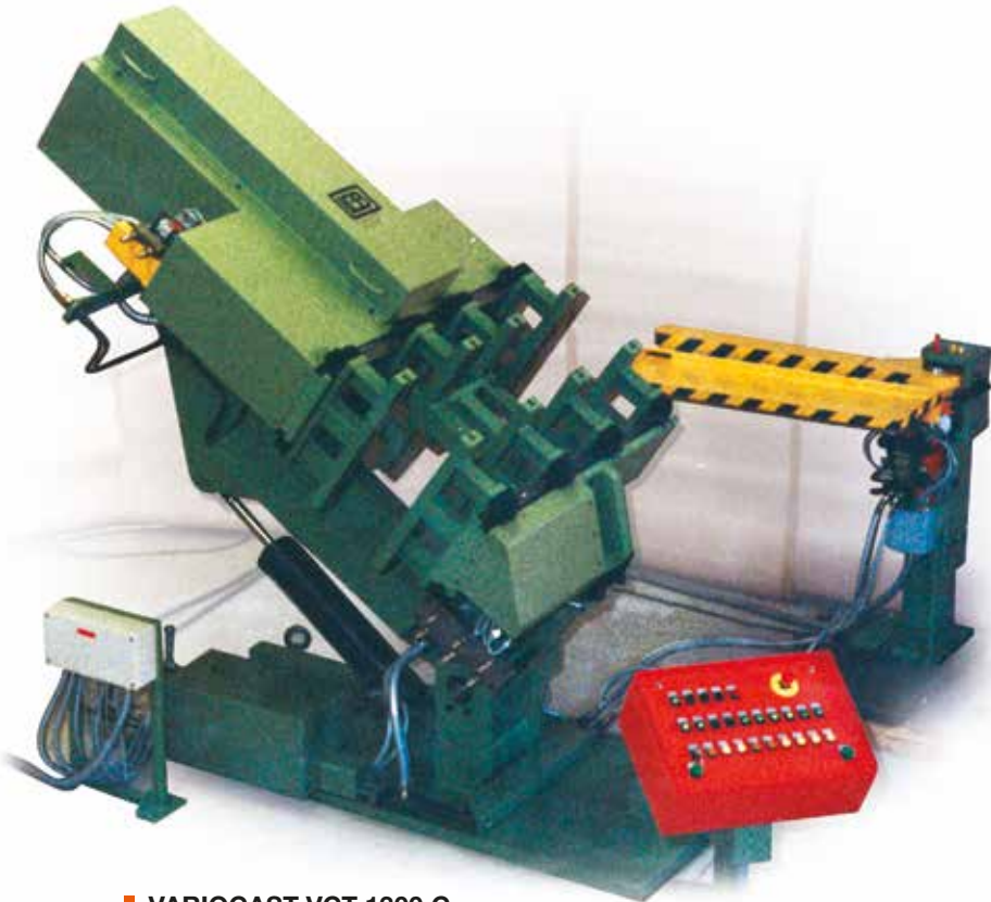
■ VARIACAST VCT 1300 C 45° gekippt, geschlossen