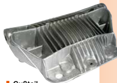
■ Gußteil "Getriebedeckel"