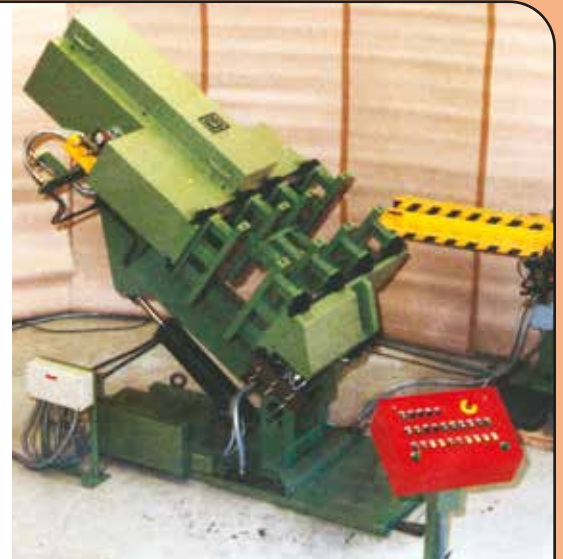
■ VARIACAST VCT 1300 C 45° gekippt, geschlossen